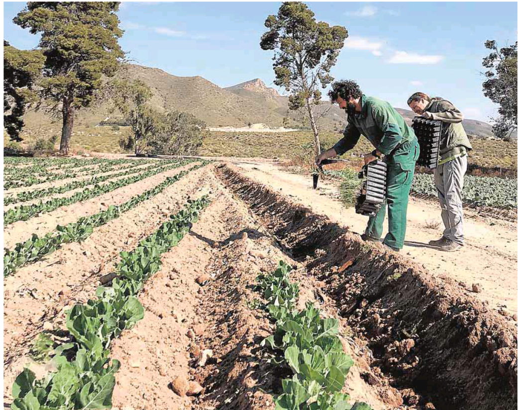
Plantación de una barrera vegetal en una finca de la Región. :: ANSE

El papel del Imida en este plan iniciado en 2019 es el de evaluar las plantas, la fauna que acogen y multitud de variables más para diseñar el seto apropiado a cada caso. El Cebas-CSIC se encarga de estudiar cómo actúa el suelo con estas barreras vegetales, tanto su capacidad de retención de carbono como, sobre todo,