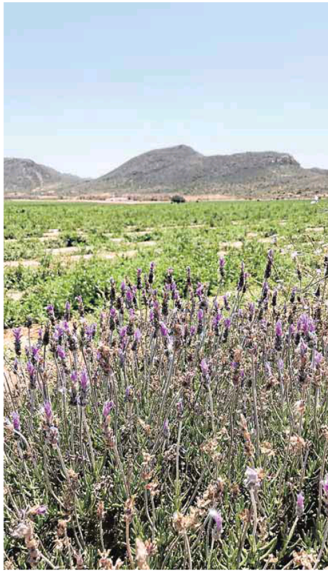
Plantas en una barrera vegetal entre cultivos. :: ANSE

como las labiadas (romeros, salvias, tomillos, lavandas, manrubios), las crucíferas (aliso, 'Lobularia maritima'), las umbelíferas (hinojos marítimos) y las leguminosas (retamas, bojas), que se emplean para atraer a fauna auxiliar y aportar recursos a los polinizadores; pasando por especies que ofrecen grandes cantidades de polen a los insectos, como las jaras y