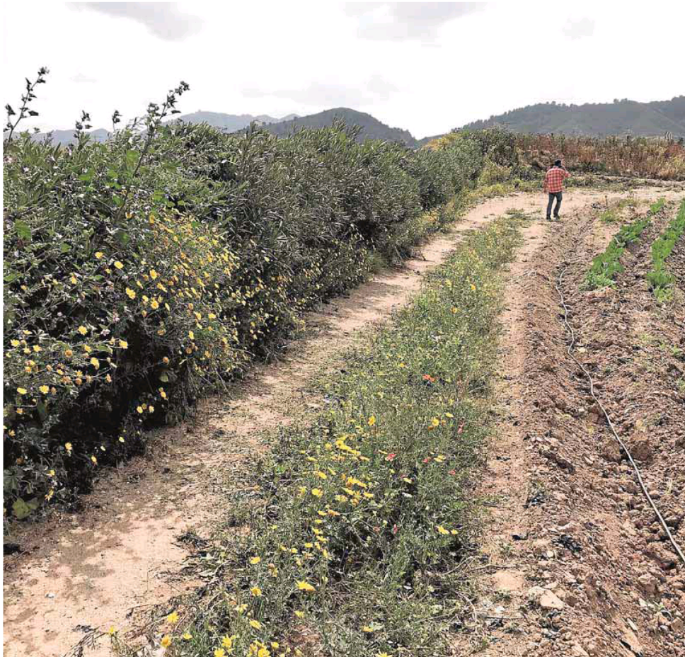
Setos junto a una plantación de hortalizas.

Un estudio del Imida, el Cebas y ANSE investiga cómo plantar barreras vegetales contra la erosión para mejorar la riqueza medioambiental y los usos agrícolas