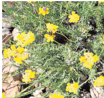
Siempreviva (Helichrysum) y baladre o adelfa ('Nerium oleander') en setos.